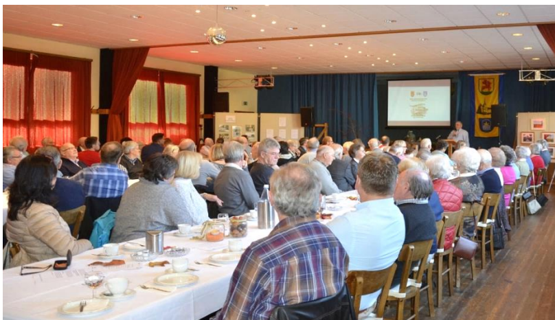
Das Publikum folgte den Vorträgen sehr aufmerksam

Nach dem rückblickenden Teil erfolgte der gemütliche mit Kaffee und Kuchen. Während dieser Zeit wurde ausgiebig geklönt, die alten Bilder an den Stellwänden begut-